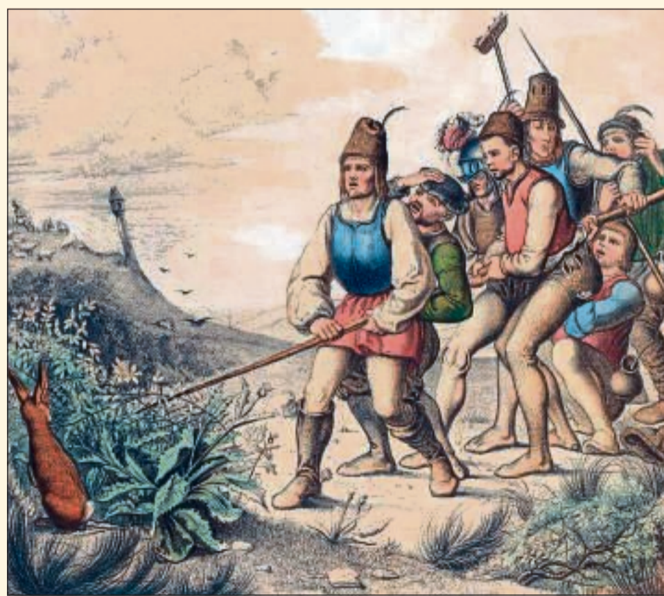
„Sieben Schwaben in Schlachtordnung“, Darstellung von 1856.

Doch dann finden sie einen Ausweg. Es soll gar keiner von ihnen sein, der Kopf, Kragen und Leib hinhält. Sie kaufen sich einfach jemanden ein, einen modernen